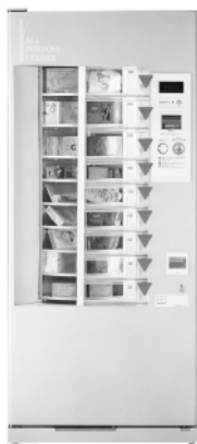
外形寸法: (W×D×H) 800×685×1830mm・重量150kg

企画・発売元 SEBE セベ産科用品株式会社 〒812-0016 福岡市博多区博多駅前4丁目11-11 TEL.(092)472-4316