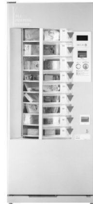
外形寸法: (W×D×H) 800×685×1830mm・重量150kg

企画・発売元 SEBE セベ産科用品株式会社 〒812-0016 福岡市博多区博多駅前4丁目11-11 TEL:(092)472-4316